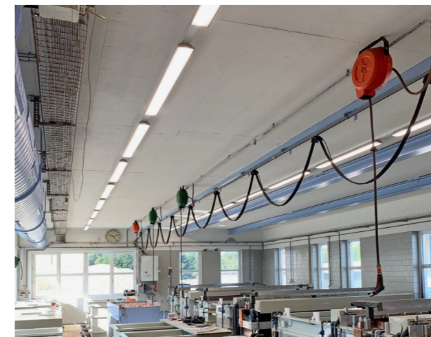
Anox AG, Galvanik-Werk, Affoltern am Albis

Sanierung durch die LED-Sporthallenleuchte SPLIT.