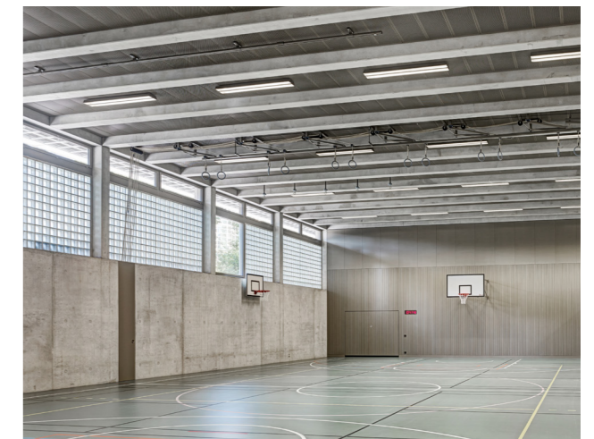
Sporthalle Schulanlage Feld, Wetzikon

Austausch alter Beleuchtung durch eine Einbauleuchten-Sonderanfertigung mit Lüftungsstützen für den Anschluss der Ab- oder Zuluftleitung.