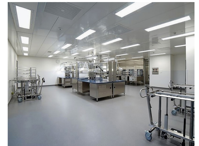
Spital Muri AG

Austausch alter FL-Beleuchtung durch die Industrieleuchte PLANK auf dem Schienensystem TURBO.