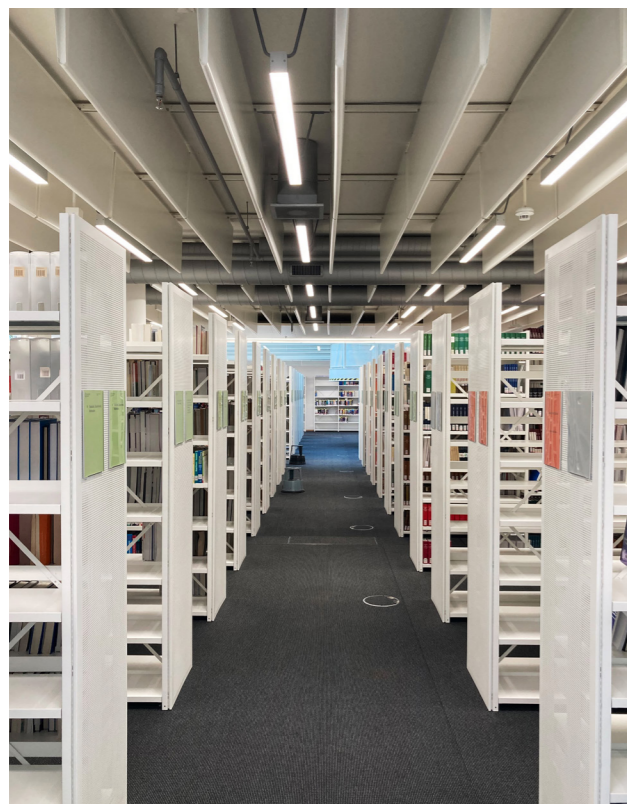
Universitätsbibliothek Binzmühlestrasse, Zürich

Sanierung mit Lichtband ZEN als Pendelvariante mit direkter und indirekter Lichtverteilung, wahlweise mit Sensorik erhältlich.