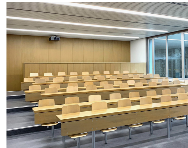
Hörsäle ETH, Zürich

Von der Bedürfnisabklärung über die benutzerorientierte Lichtplanung bis hin zur Entwicklung und zum Einsatz der optimalen Beleuchtungsprodukte bieten wir sämtliche Sanierungsoptionen an. Vertrauen Sie auf unsere jahrelange Erfahrung aus zahlreichen erfolgreich umgesetzten Projekten.