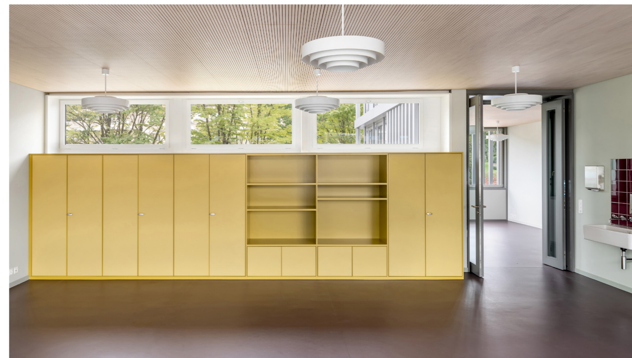
Schulhäuser Hofmatt 1 und 2, Meggen

Durch das enorm hohe Einsparpotenzial und das Ausschöpfen attraktiver Fördergelder lässt sich selbst eine Komplettsanierung häufig schnell amortisieren und ist langfristig die Variante mit der höchsten Nachhaltigkeit und dem besten Nutzerkomfort.