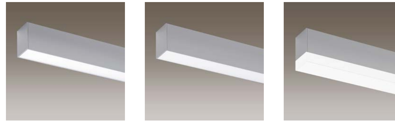
Verre acrylique satiné, affleurant