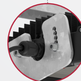
Angolo di incidenza regolabile