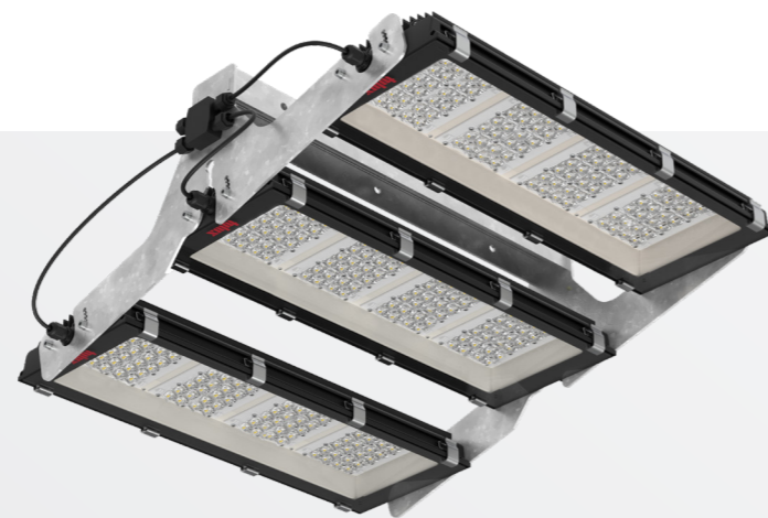
Unità proiettore con tre moduli 156.000 lm - 190.000 lm

L'elevata efficienza energetica (fino a 125 lm/W) e la lunga durata dei LED (fino a 100.000 ore) riducono notevolmente i costi operativi. Facilità di manutenzione grazie alla box con apparecchiature elettroniche esterna sul candelabro.