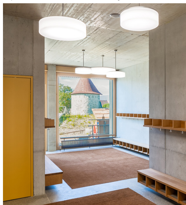
Dans les vestiaires, des modèles SPIN de différentes tailles ont été placés à différentes hauteurs.