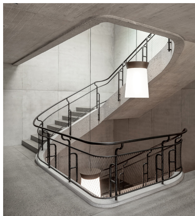
Dans les cages d'escalier, les luminaires pendentifs soulignent la verticalité de l'espace et assurent le lien entre les différents étages.