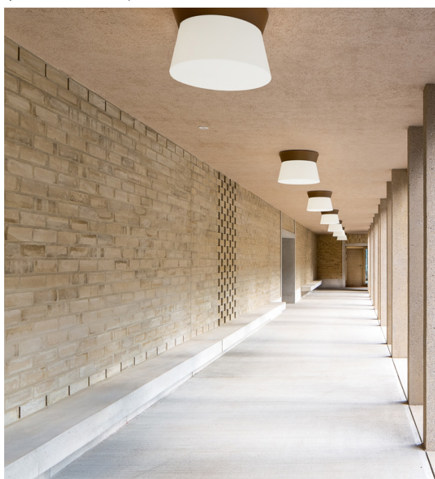
Les luminaires situés sous les arcades mettent en avant le rythme des piliers en béton et créent une atmosphère conviviale.