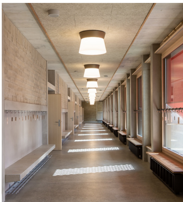
Grâce à un positionnement central et aligné, les plafonniers accentuent le rythme distinctif des façades intérieures.

SWISS LIGHT CREATIONS DES LUMINAIRES SUR MESURE ÉVOLUANT AU RYTHME DE L'ARCHITECTURE